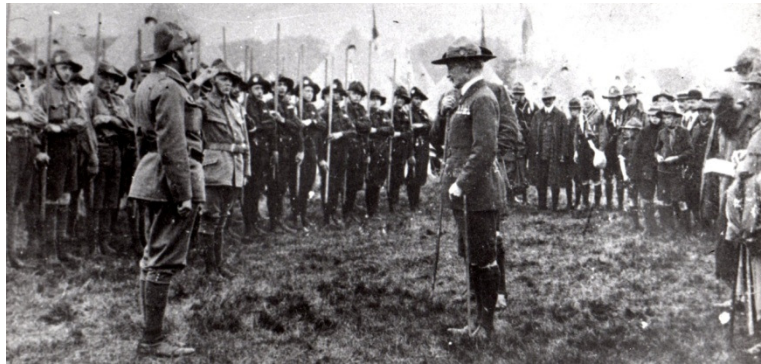
1913 Birmingham – Baden-Powell wita polskich skautów

W październiku 1913r. wprowadzono jednolite oznaki skautowe obowiązujące do dziś: krzyż harcerek i lilijka .